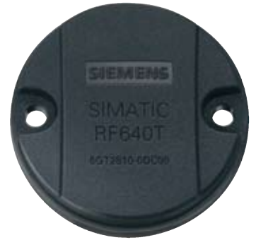
Der SIMATIC RF640T: Tool-Tag direkt auf Metall applizierbar.

Mit dem Transponder SIMATIC RF640T wird das RFID-System SIMATIC RF600 von Siemens um einen kleinen, robusten, wiederbeschreibbaren Datenspeicher erweitert. Der Tool-Tag ist direkt auf Metall montierbar, hat eine Erfassungsreichweite von zwei Metern und ist so für das Asset-Management von Werkzeugen und Behältern geeignet. Er weist eine hohe Beständigkeit gegen Öle, Schmier- und Reinigungsmittel auf und ist konform zu dem ISO-Standard 18000-6B. Bei Temperaturen von minus 25 Grad Celsius bis plus 85 Grad Celsius ist der Transponder in den Frequenzen 865 bis 868 MHz und 905 bis 928 MHz einsetzbar.