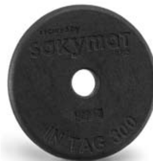
Der IN-Tag F-MEM 16kbit: seine große Speicherkapazität ermöglicht eine Erfassung von 2.000 Zeichen.

Der Sokymat IN Tag F-Mem 16kbit von Assa Abloy Identification Technologies wurde speziell für anspruchsvolle Umgebungen in