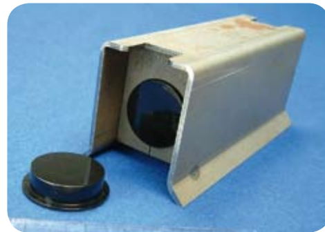
Durch die robuste Kunststoffeinfassung für den Industrieinsatz geeignet: der smart-DOME MOM.

Der RFID-Datenträger smart-DOME MOM von smart-TEC ist robust gegen Witterungseinflüsse und resistent gegen chemische sowie thermische Belastungen. Durch die Veredelung mit einem robusten, bruchfesten und witterungsbeständigen Kunststoff ist der RFID-Chip für die rauen Bedingungen des Industrieinsatzes ebenso geeignet wie für die Außenanwendungen. Der Transponder wird für den dauerhaften Einsatz bei der Kennzeichnung von Metallbauteilen oder Metallbehältern benutzt und ist mit den gängigen passiven Chiptechnologien verfügbar. Die störenden Einflüsse von Metall auf die Datenkommunikation konnten beseitigt werden.