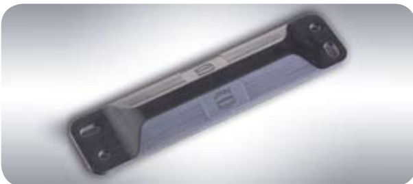
Passiver UHF-Transponder: auch gegen Chemikalien beständig.

Die Hochtemperatur-Datenträger von Turck arbeiten aufgrund einer speziellen Ummantelung in einem Temperaturbereich von minus 40 Grad Celsius bis zu plus 210 Grad Celsius und können damit sogar durch Brennöfen fahren, wie sie in der Automobilproduktion zum Fixieren des Lacks eingesetzt werden.