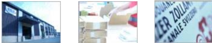
Oberstrasse, St. Gallen

Customer Care, Fulfillment, Retourenmanagement