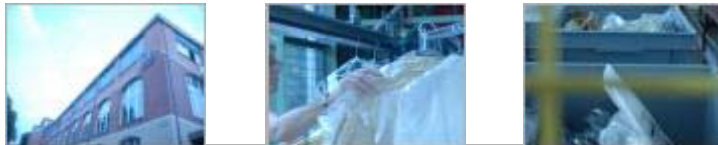
Rittmeyerstrasse, St. Gallen

Fulfillment, Verzollung Retourenmanagement