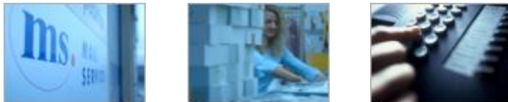
Scheibenstrasse, Lauterach (Österreich)

Customer Care, Fulfillment, Retourenmanagement