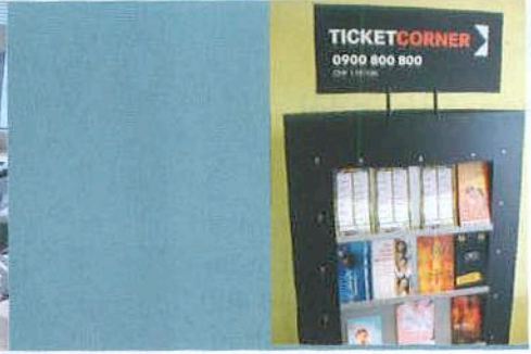
| Programmstände Ticketcorner

Anschaffungspreis des von Ticketcorner ausgewählten Modells lag darüber hinaus pro Stück nahezu ein Drittel unter der zuvor überwiegend verwendeten Drucklösung – nicht irrelevant bei insgesamt fast 350 geordneten Druckern. Zudem gab es sämtliche Wettbewerbsmodelle in keiner ähnlich günstigen Preislage.