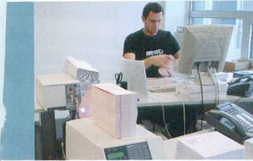
| Kartendruck bei Ticketcorner: Der Intermec EasyCoder PF4i arbeitet störungsfrei und ist intuitiv bedienbar